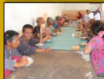
Te weinig om van te leven